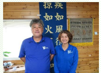
事務所にて、永吉代表と清美夫人